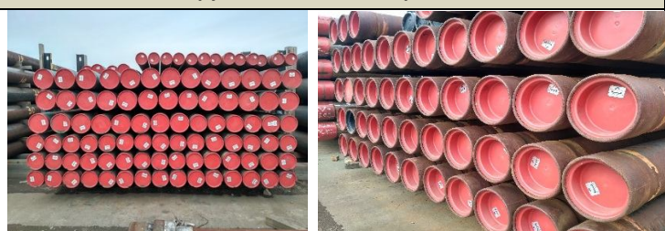
Стропы для труб большого диаметра Ø 36"