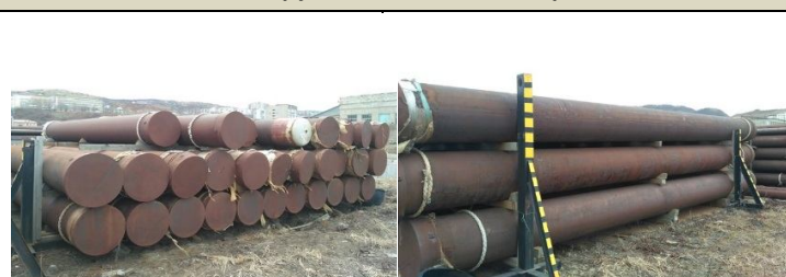
Патрубки, переводники Ø 244,5, 273,1, 339,7 мм.

Обсадные трубы, малого диаметра Ø 177 и 339 мм