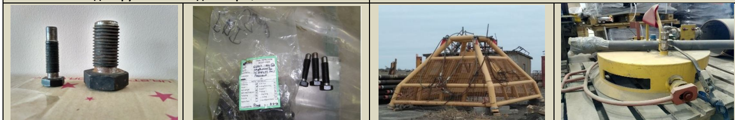
Элементы устьевого оборудования

Способ реализации – публичное предложение в электронной форме, проводимое на электронной торговой площадке ООО «ЭТП ГПБ»