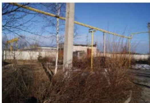
Фото 2. Вид на трансформаторную подстанцию