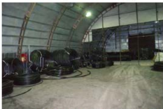
Фото 14. Внутреннее состояние помещений