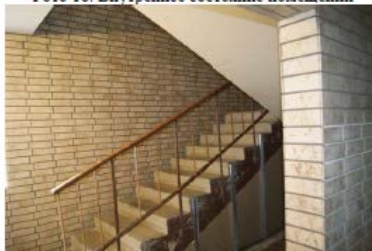
Фото 20. Внутреннее состояние помещений