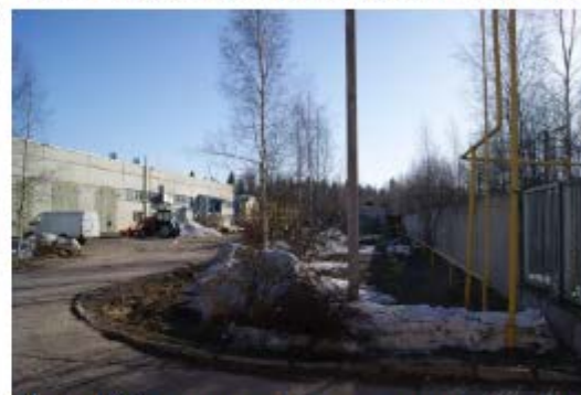
Фото 4. Вид от ворот на склад вспомогательных материалов и на производственный корпус с пристройкой