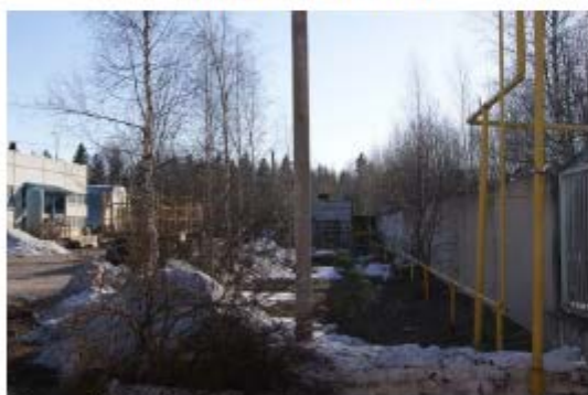
Фото 5. Вид от ворот на склад вспомогательных материалов