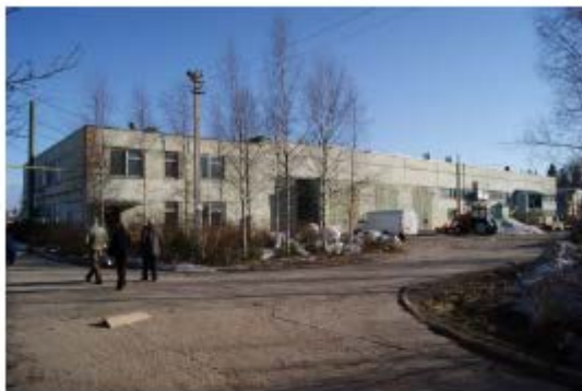
Фото 9. Производственный корпус с пристройкой