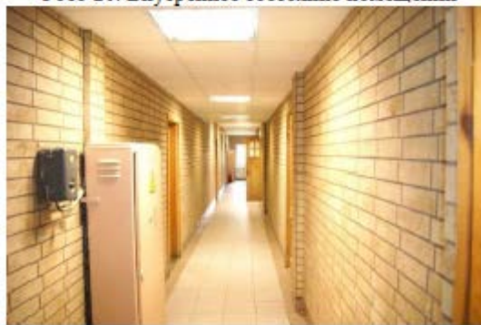
Фото 22. Внутреннее состояние помещений