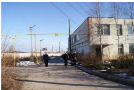
Фото 11. Производственный корпус с пристройкой