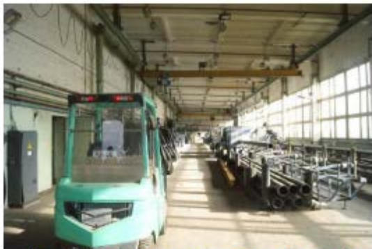
Фото 17. Внутреннее состояние помещений