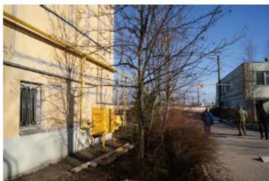
Фото 1. Вид на СБК и производственный корпус с пристройкой