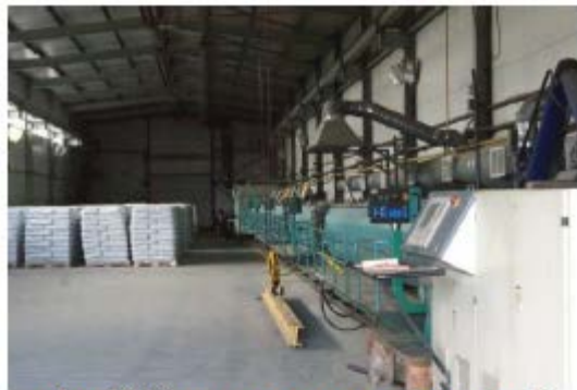
Фото 18. Внутреннее состояние помещений