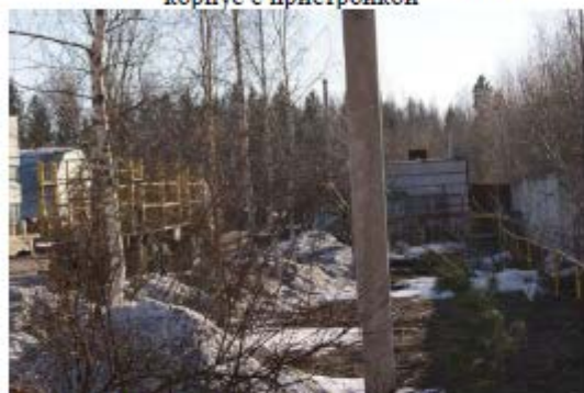
Фото 3. Вид от ворот на склад вспомогательных материалов и на ангар