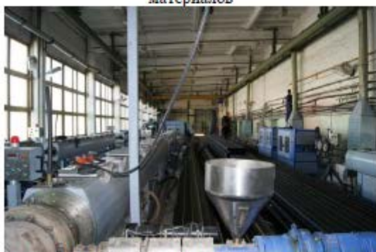
Фото 7. Производственный корпус с пристройкой