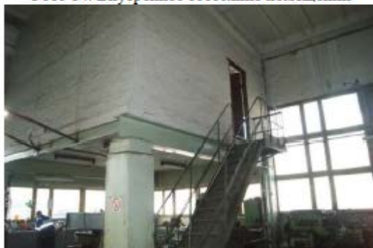
Фото 16. Внутреннее состояние помещений