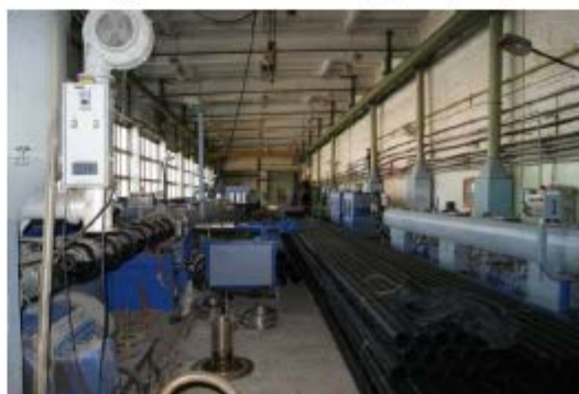
Фото 8. Производственный корпус с пристройкой