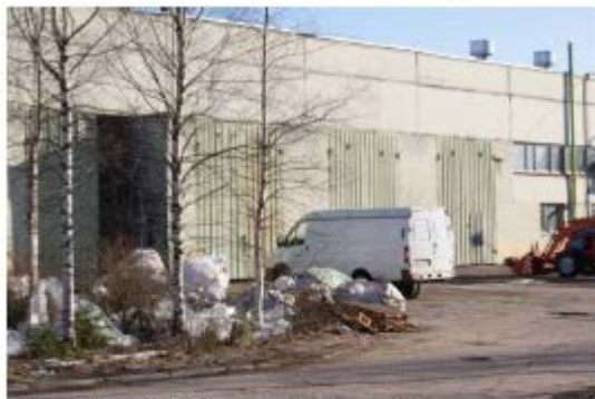
Фото 10. Производственный корпус с пристройкой