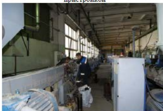
Фото 6. Производственный корпус с пристройкой