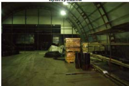
Фото 13. Внутреннее состояние помещений