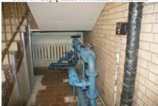
Фото 21. Внутреннее состояние помещений