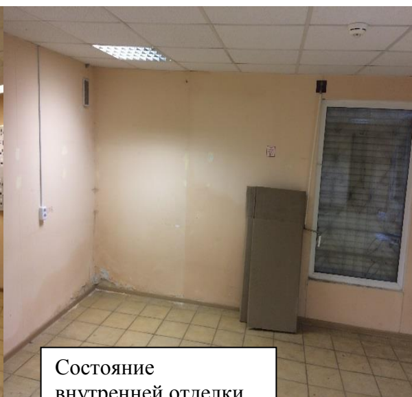
Состояние внутренней отделки помещений объекта