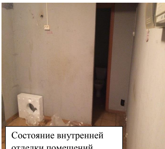
Состояние внутренней отделки помещений объекта