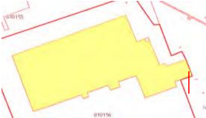
Форма земельного участка